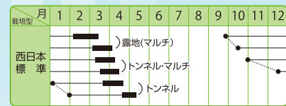
※栽培型は地方により異なりますので、貴地の気候に合わせて栽培して下さい。

●耐寒性が強く、特にス入りと抽苔の遅い、暖地での3～4月どりによい良質の青首つまり大根。●葉は濃緑色の小葉でコンパクト、暖地の露地栽培や、一般地のマルチ栽培に向く。●根長35～36cm、根重1.2kg内外となる。首は淡緑色、ヒゲ根が細く、肌は純白で美しい。●青首内部の青肉が少なく、肉質は緻密にしまり、品質と食味が非常によい。